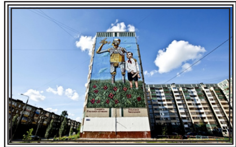
Граффити Pixel Pancho (Италия)