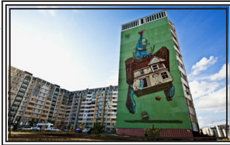
Граффити Etam Cru (Sainer & Bezt) (Польша)

Пиксель Панчо — мастер стрит-арта итальянского происхождения. Он активно путешествует и создает огромные муралы (большие граффити) в основном в одиночку, имеет профессиональное художественное образование, что встречается, как ни странно, очень редко в рядах стрит-артистов. Сформировал свой уникальный стиль «машинариум». Главными героями его сюжетов являются ретро-роботы и механизированные персонажи, потрепанные временем.